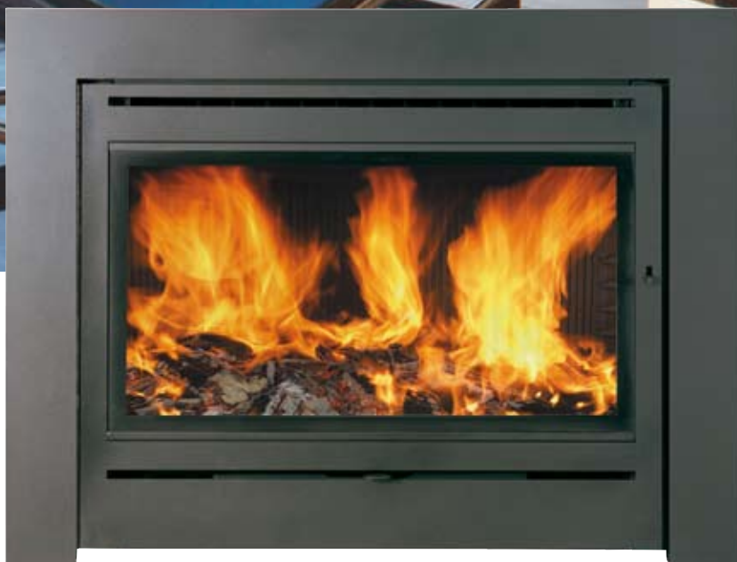
Inserto C-11 Compact con cornice decorativa