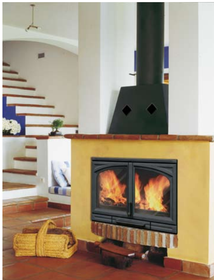
Esempio di rivestimento con cappa a vista